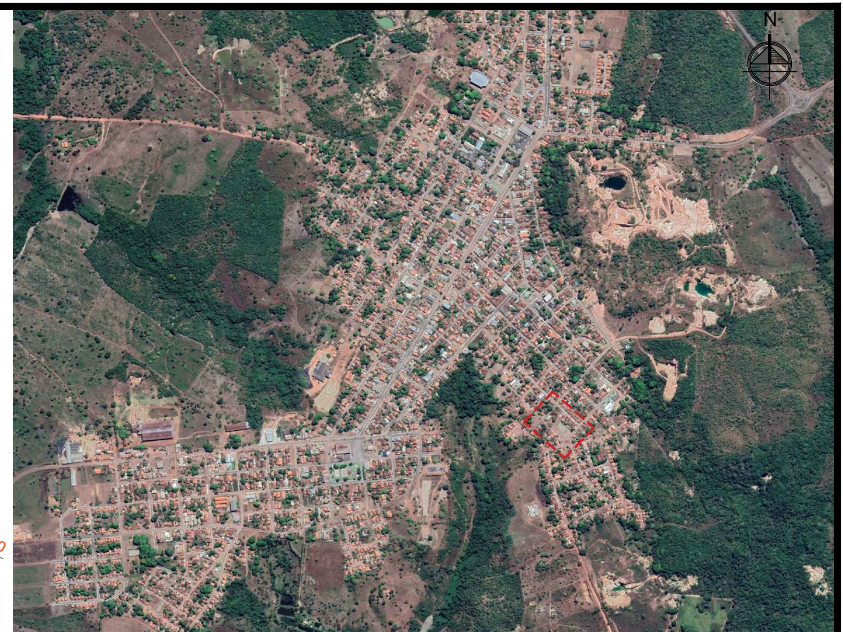
PLANTA DE SITUAÇÃO S/ ESCALA